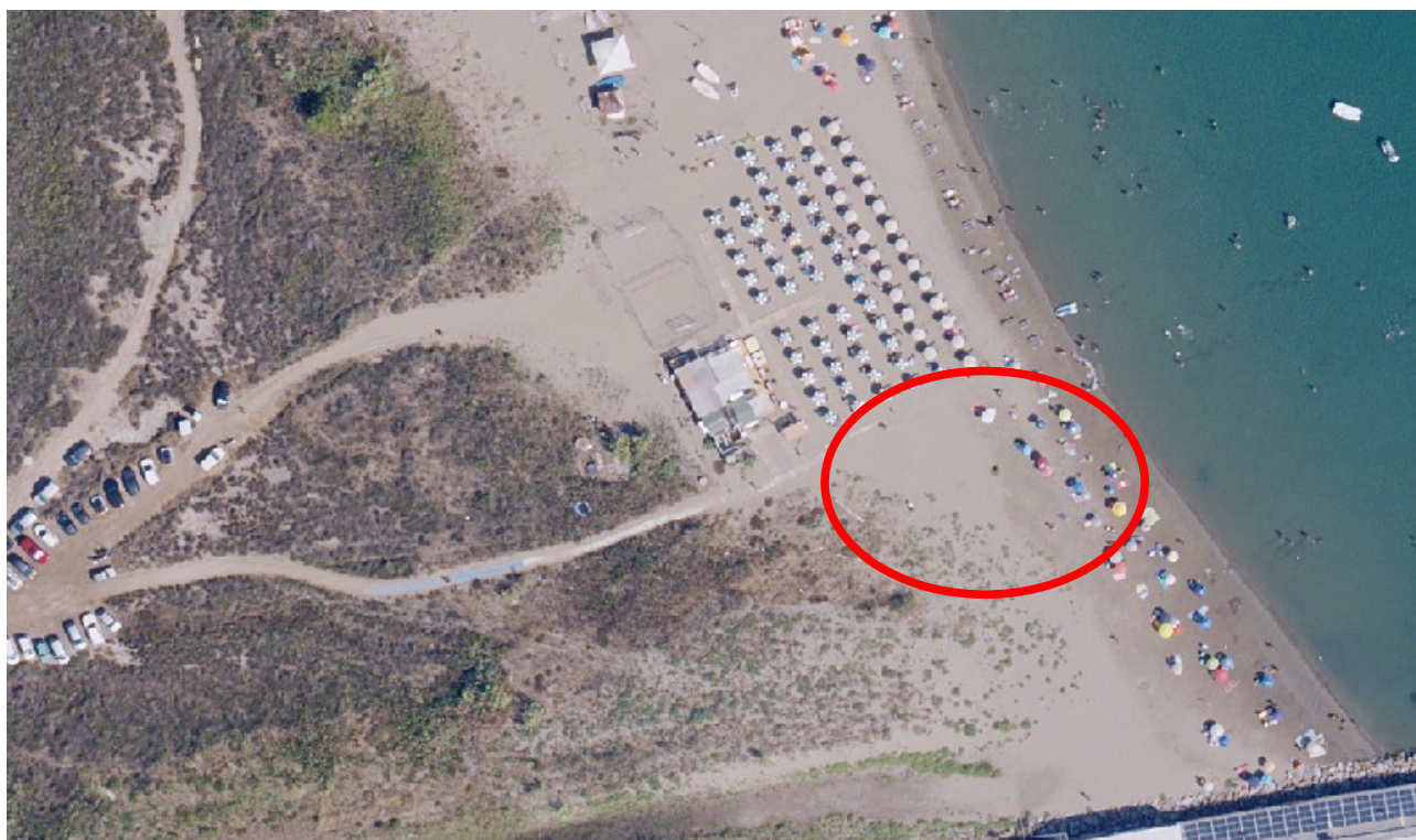
Spiaggia di Cala Galera, con evidenza dell'area di intervento

Intervento volto al miglioramento del livello di accessibilità della spiaggia di Cala Galera – Porto Ercole (GR)